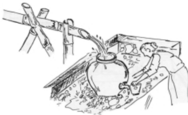
Gambar 3. Penyaluran Air untuk Konsumen